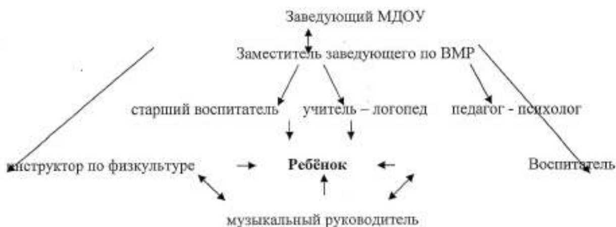
Схема взаимодействия специалистов МДОУ «Детский сад № 21»

Повышение квалификации своевременно проходят 26 педагогических работников, 1 руководитель учреждения. Нагрузка на педагогов согласно соотношению между количеством воспитанников и количеством педагогов нагрузка на 1 педагогического работника в среднем составляет 11 человек.